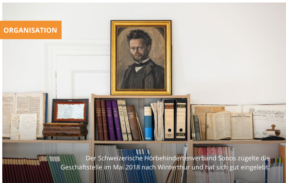
Der Schweizerische Hörbehindertenverband Sonos zügelte die Geschäftsstelle im Mai 2018 nach Winterthur und hat sich gut eingelebt.